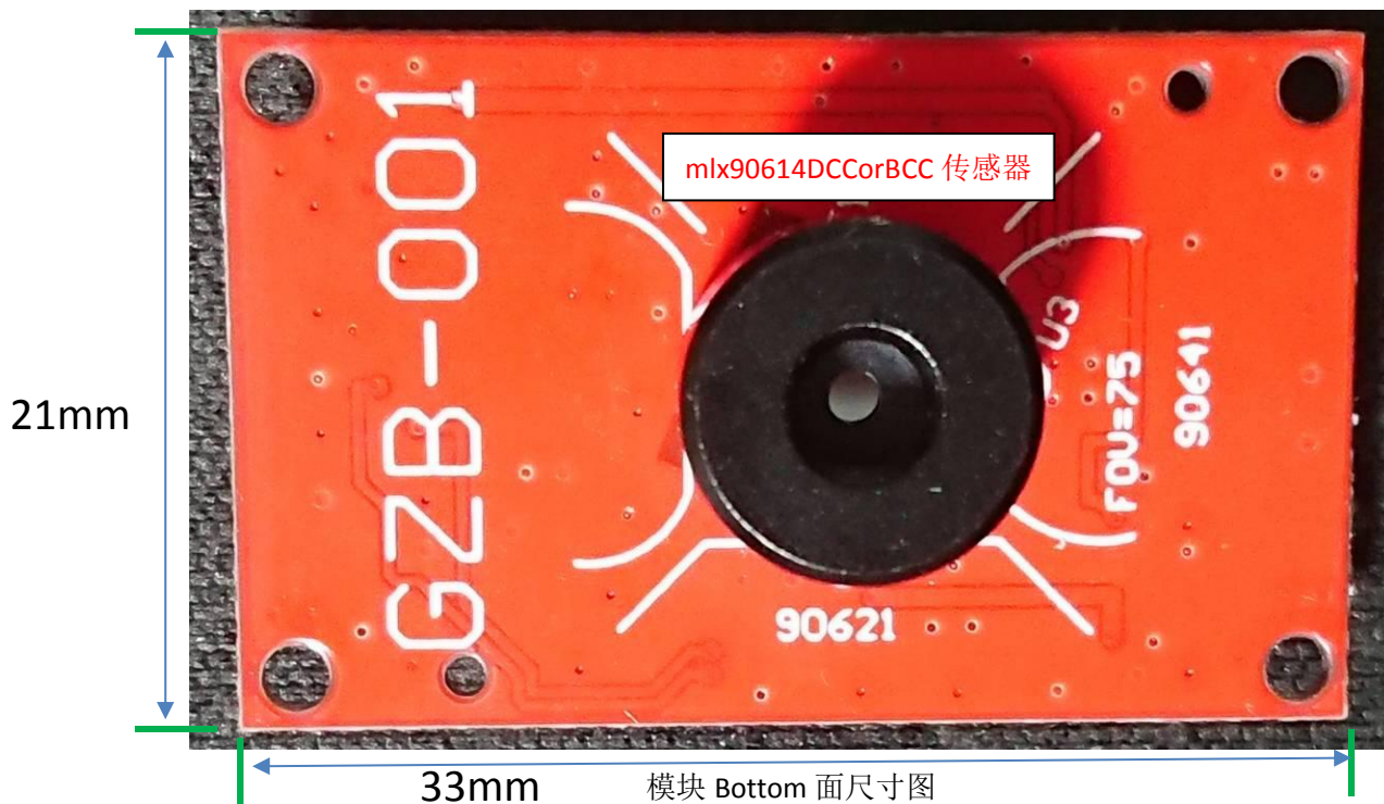
模块 Bottom 面尺寸图